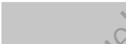
silbergrau / silver grey 106* (DB 704)