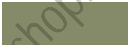
bronzegrün / bronze green 182 (DB 601)