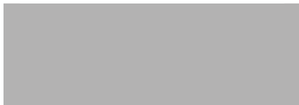
alugrau hell / light aluminium grey 177 (DB 701)